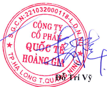
Đỗ Trí Vỹ