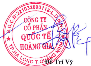
Đỗ Trí Vỹ