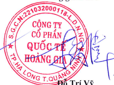
Đỗ Trí Vỹ