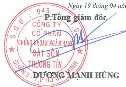
DƯƠNG MẠNH HÙNG