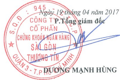
DƯƠNG MẠNH HÙNG