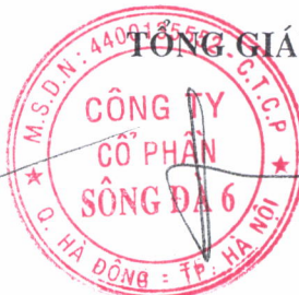
Đặng Quốc Bảo