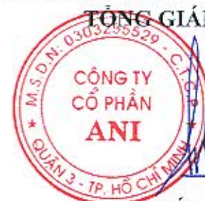
Đặng Tất Thành