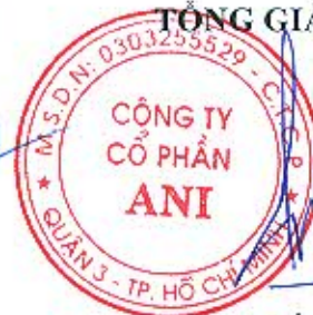
Đặng Tất Thành