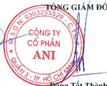
Đặng Tất Thành