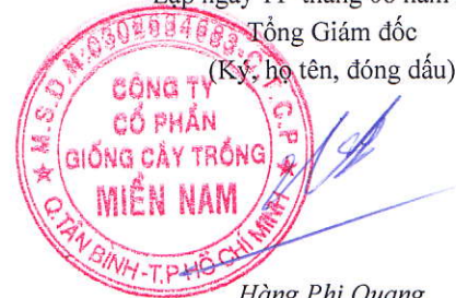
Hàng Phi Quang