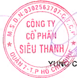
YUNG CAM MENG