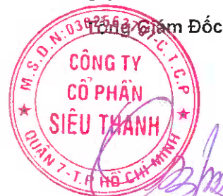
YUNG CAM MENG