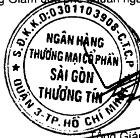
Tổng Giám Đốc