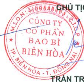
TRẦN TRANG BÌNH