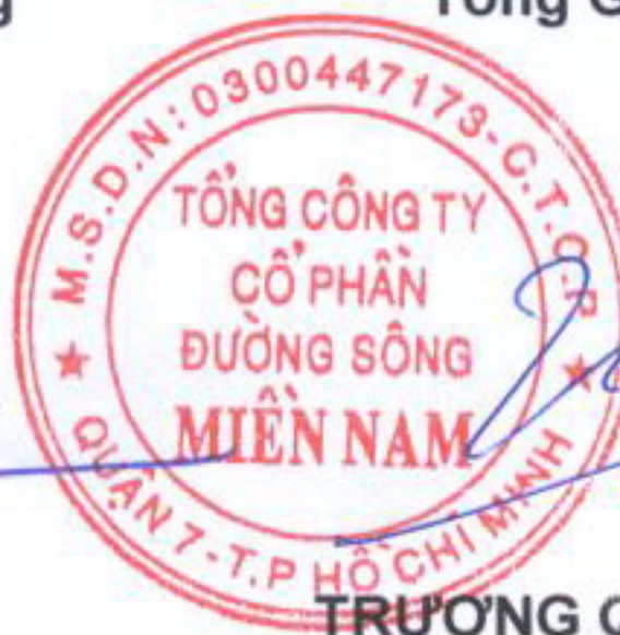
TRƯƠNG QUỐC HƯNG