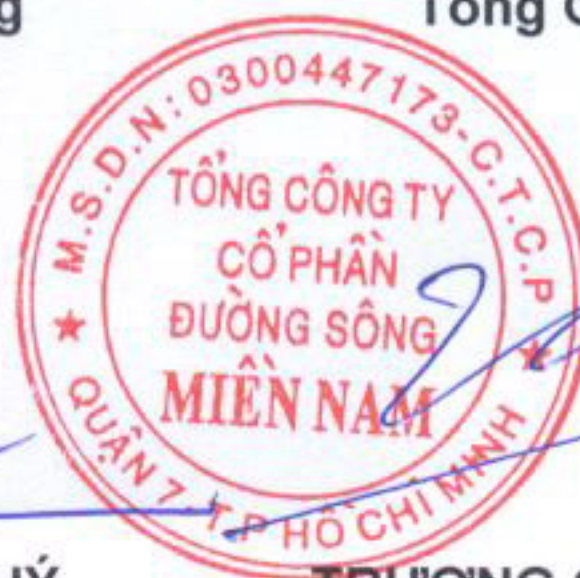
TRƯƠNG QUỐC HƯNG