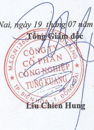
Lưu Chiên Hưng