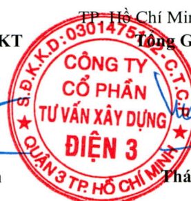
Phái Tuấn Tài