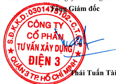
Thái Tuấn Tài