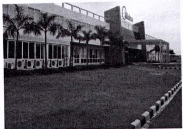
Thi công sân vườn