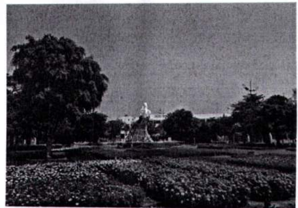
Công trình đường hoa

Trải qua hơn 23 năm hình thành và phát triển, Công ty đã không ngừng lớn mạnh và ngày càng chuyên nghiệp trong lĩnh vực hoạt động của mình. Các dịch vụ chính của Công ty bao gồm: Dịch vụ thi công, dịch vụ chăm sóc, dịch vụ cho thuê và dịch vụ tư vấn – thiết kế.