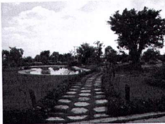
Công trình công viên

Công ty Cổ phần Phát triển Công viên Cây xanh & Đô thị Vũng Tàu là doanh nghiệp hoạt động chính trong lĩnh vực quản lý, chăm sóc, bảo vệ, duy tu, tôn tạo, trồng mới công viên, cây xanh đô thị thành phố Vũng Tàu thiết kế các dịch vụ sân vườn hoa cây cảnh và hoạt động theo hướng đa ngành nghề, đa lĩnh vực.