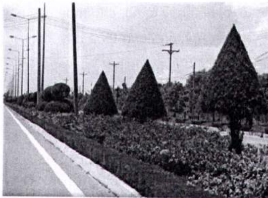
Trồng cây xanh trên đường