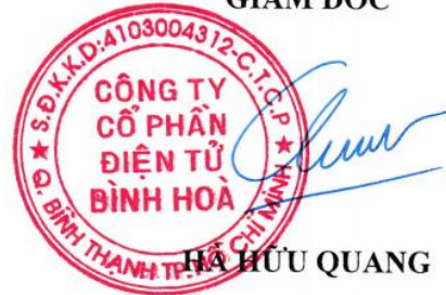
HÀ HỮU QUANG