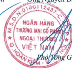
Phó Tổng Giám đốc