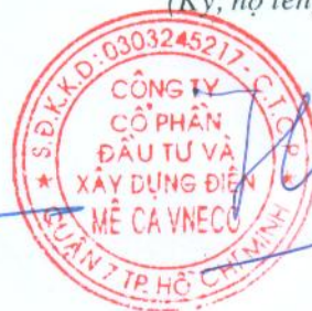
Lâm Quốc Hải