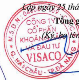
Trương Thế Tùng