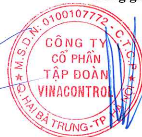
Mai Tiến Dũng