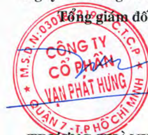
TRƯƠNG THÀNH NHÂN