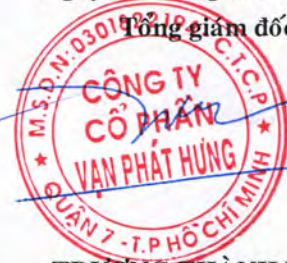
TRƯƠNG THÀNH NHÂN