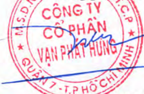
TRƯƠNG THÀNH NHÂN