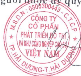
Phạm Ngọc Thảo