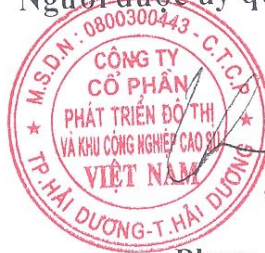
Phạm Ngọc Thảo