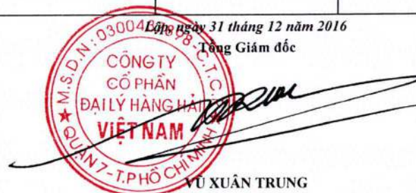
VU XUÂN TRUNG