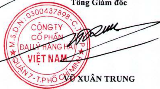
VÕ XUÂN TRUNG