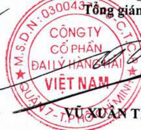
VŨ XUÂN TRUNG