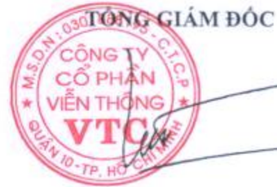
LÊ XUÂN TIÊN