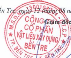
PHAN QUỐC THÔNG