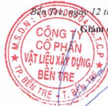
PHAN QUỐC THÔNG