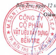
PHAN QUỐC THÔNG