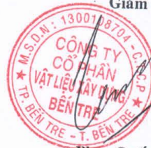
Phan Quốc Thông