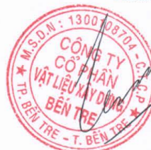
Phan Quốc Thông