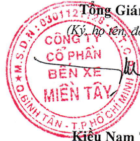
Kiều Nam Thành