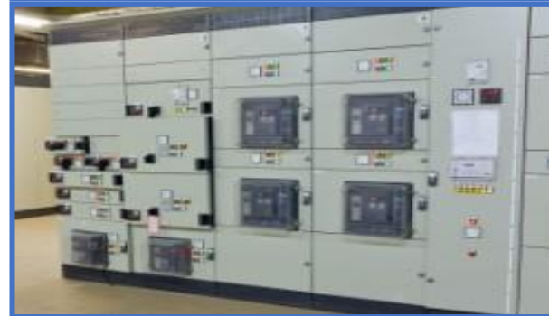
Điện tự động (EC&I)