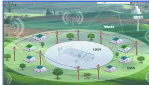
Tin học Viễn thông (ICT)