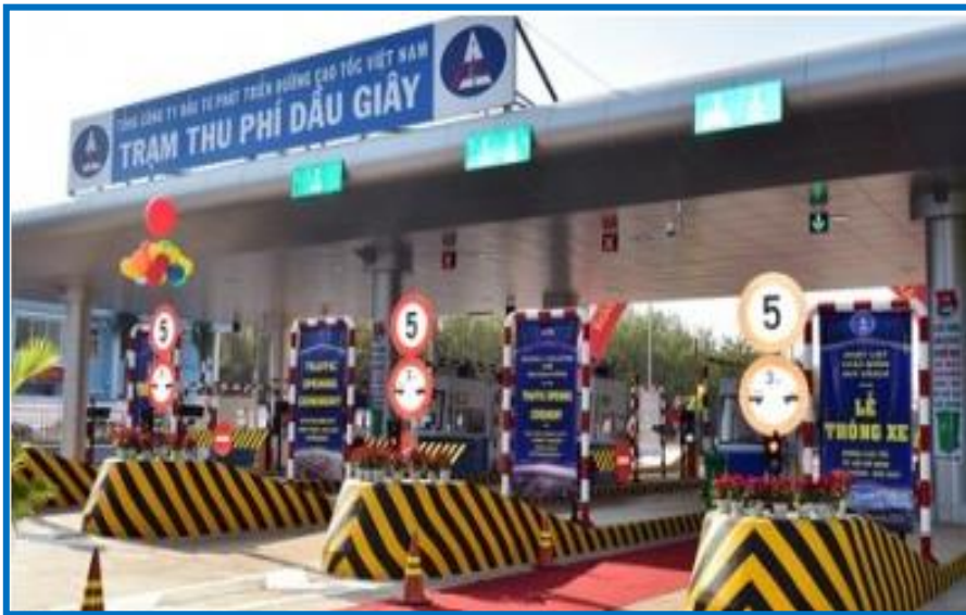
Giao thông thông minh (ITS)