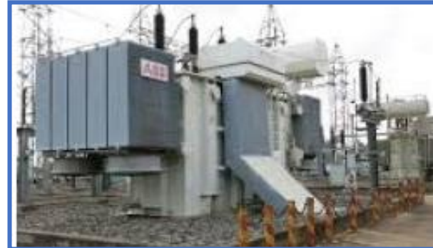
Hạ tầng Kỹ thuật điện (ETI)