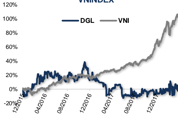
Biến động giá cổ phiếu DGL và VNINDEX