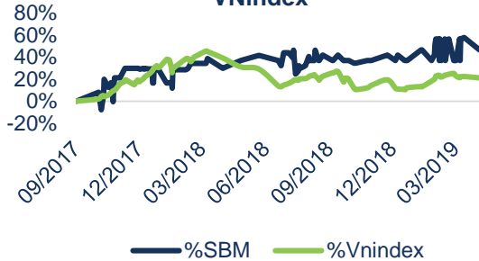
Biến động giá cổ phiếu SBM và VNindex