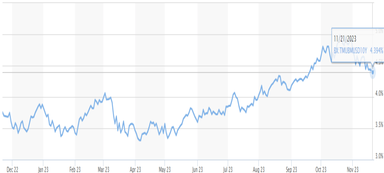
Lãi suất trái phiếu 10 năm tại Mỹ (Nguồn: Market Watch)