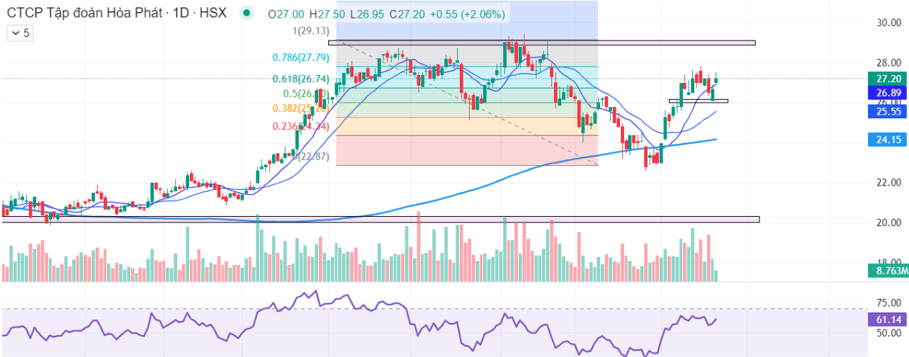
Biểu đồ giá của HPG (theo ngày)