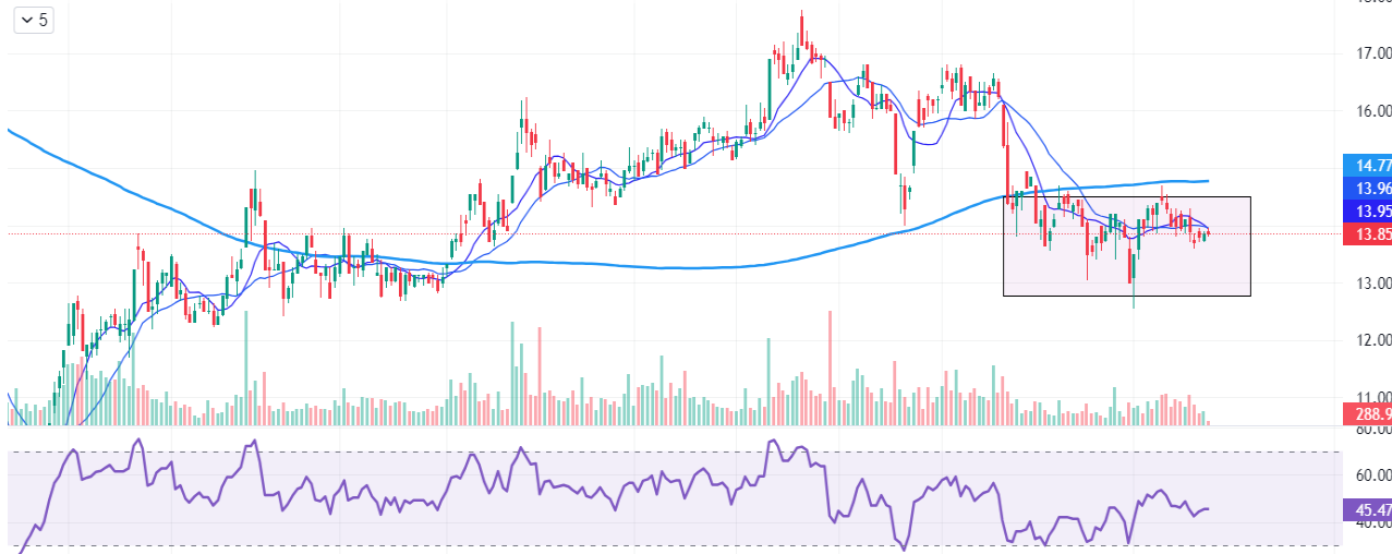
Biểu đồ giá của SBT (theo ngày)

O 13.90 H 13.95 L 13.80 C 13.85 0.00 (0.00%)