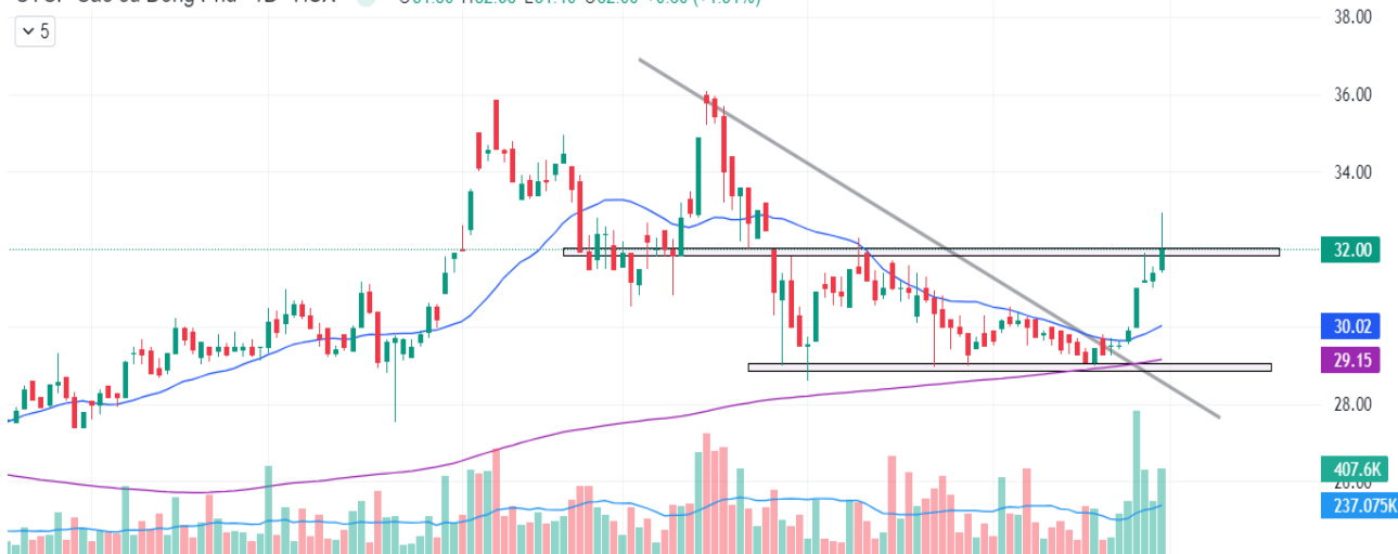
Biểu đồ giá của DPR (theo ngày)