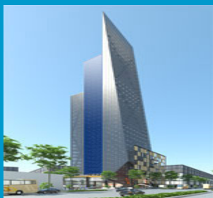
DỰ ÁN LÊ LỢI PLAZA