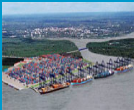
CẢNG CÁI MÉP