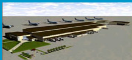
CẢNG HÀNG HÓA HÀNG KHÔNG TÂN SƠN NHẤT