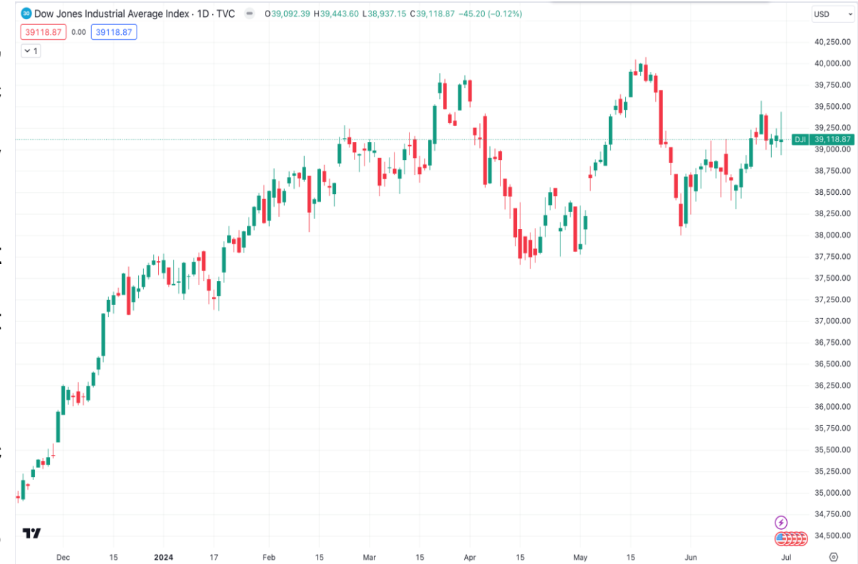
Diễn biến chỉ số Dow Jones