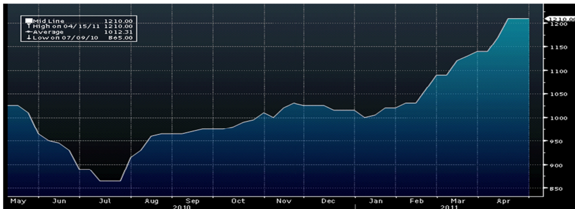
Biến động giá nguyên liệu PVC

Hạt nhựa là sản phẩm từ dầu nên diễn biến giá hạt nhựa biến động chặt chẽ và cùng chiều với giá dầu. Vừa qua giá dầu tăng giá hiện đang duy trì ở mức cao, cùng với động đất và sóng thần tại Nhật Bản - nơi cung cấp nguyên liệu nhựa lớn nên giá hạt nhựa đã tăng mạnh kể từ đầu năm 2011, hiện đang duy trì ở mức 1.210 USD/tấn tăng 19,5% so với mức giá trung bình năm 2010. Giá dầu trong thời gian vừa qua đã có lúc duy trì trên 110 USD/thùng tuy nhiên trong mấy ngày gần đây đã sụt giảm mạnh, hiện giá nhựa đã đi ngang duy trì ở mức 1.210 USD/tấn chúng tôi cho rằng giá dầu sẽ sớm giảm duy trì ở dưới mức 100 USD/thùng và thị trường cung cấp nguyên liệu nhựa tại Nhật Bản ổn định trở lại khi đó giá nguyên liệu nhựa sẽ điều chỉnh giảm xuống mức thấp hơn hiện nay. Chi phí nguyên liệu hạt nhựa chiếm khoảng 70-80% giá thành sản phẩm do đó những biến động về giá hạt nhựa sẽ ảnh hưởng ngay đến kết quả hoạt động sản xuất kinh doanh của các doanh nghiệp sản xuất nhựa. Mặc dù doanh nghiệp nhựa có thể điều chỉnh giá sản phẩm đầu ra khi nguyên liệu đầu vào tăng tuy nhiên đây là phương án cuối cùng mà doanh nghiệp phải lựa chọn bởi vì thị trường ống nhựa xây dựng cạnh tranh rất mạnh.