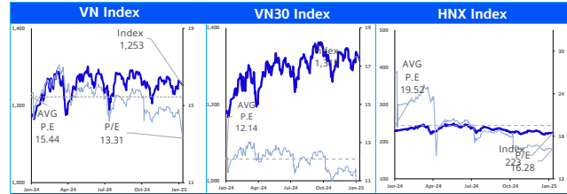
Các chỉ số chính trên thị trường chứng khoán Việt Nam

Chiến lược: Thị trường đang theo xu hướng trading sideway chủ đạo. Nếu trading ngắn hạn, nhà đầu tư có thể cân nhắc giải ngân quanh vùng 1,240 điểm và chốt lời dần khi tiến về 1,300 điểm. Với chiến lược nắm giữ, nhà đầu tư có thể giải ngân thêm khi VN-Index vượt khỏi và bảo vệ thành công vùng 1,300 điểm.