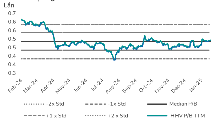
Hình 4: Định giá P/B của HHV