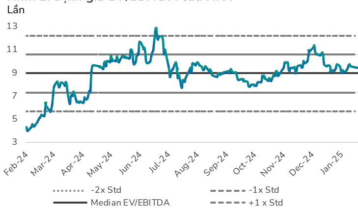
Hình 2: Định giá EV/EBITDA của HHV