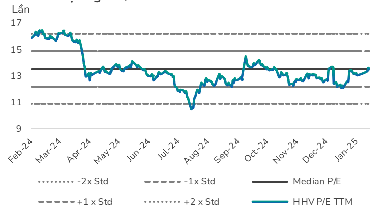
Hình 3: Định giá P/E của HHV