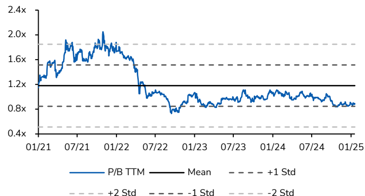
Hình 1: Định giá P/B của OCB Lần