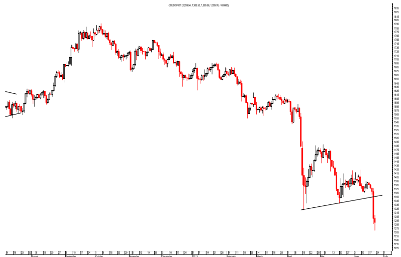
(Giá vàng giao ngay từ tháng 8/2012-6/2013)

Việc Fed cắt giảm gói QE do nền kinh tế Mỹ tiến triển tốt sẽ tạo ra hệ quả là đồng USD mạnh lên, gây tác động không tốt với giá vàng. Vàng lập tức giảm giá mạnh, rớt xuống dưới mức 1300 USD/ounce, là mức thấp nhất kể từ tháng 9/2010. Chúng tôi nhận thấy rằng vàng đã trong xu hướng giảm từ đỉnh 1800 vào tháng 10/2012. Với việc tiếp tục tạo các mức thấp mới, chúng tôi cho rằng các đợt phục hồi của vàng (nếu có) là không bền vững. Nếu có thể phục hồi, vàng sẽ chịu cản ở khoảng 1350 USD/ounce.