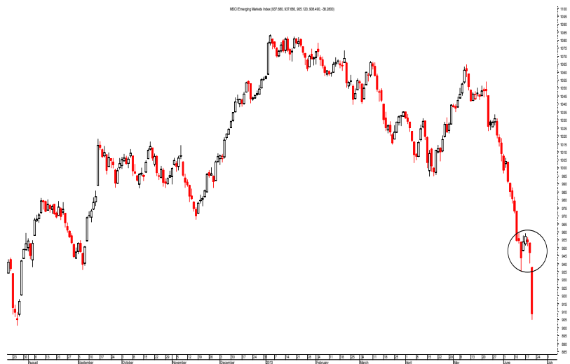
(Chỉ số MSCI Emerging Markets Index, từ tháng 8/2012-6/2013)

Việc Fed cắt giảm gói QE do nền kinh tế Mỹ tiến triển tốt sẽ tạo ra hệ quả là đồng USD mạnh lên, gây tác động không tốt với giá vàng. Vàng lập tức giảm giá mạnh, rớt xuống dưới mức 1300 USD/ounce, là mức thấp nhất kể từ tháng 9/2010. Chúng tôi nhận thấy rằng vàng đã trong xu hướng giảm từ đỉnh 1800 vào tháng 10/2012. Với việc tiếp tục tạo các mức thấp mới, chúng tôi cho rằng các đợt phục hồi của vàng (nếu có) là không bền vững. Nếu có thể phục hồi, vàng sẽ chịu cản ở khoảng 1350 USD/ounce.