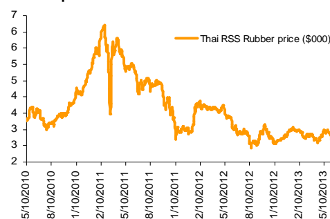
Hình 2: Giá cao su RSS3 tại Thái Lan