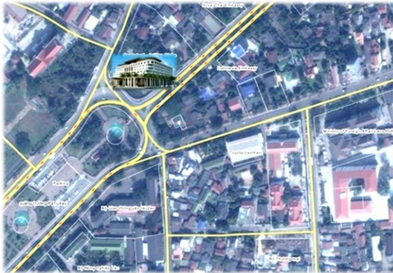
Vị trí Dự án Viêng Chăn - Lào