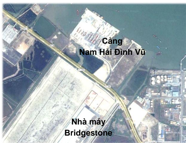
Vị trí Cảng Nam Hải Đình Vũ

hoạt động cho thuê văn phòng trong năm 2014 sẽ giảm so với cùng kỳ lần lượt là 40.86 tỷ đồng và 24.14 tỷ đồng.