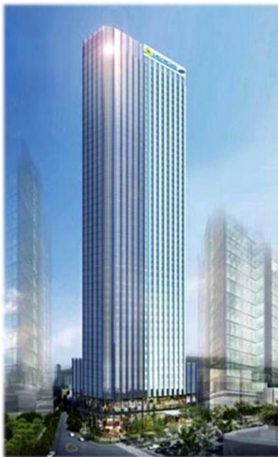
Dự án Saigon Gem