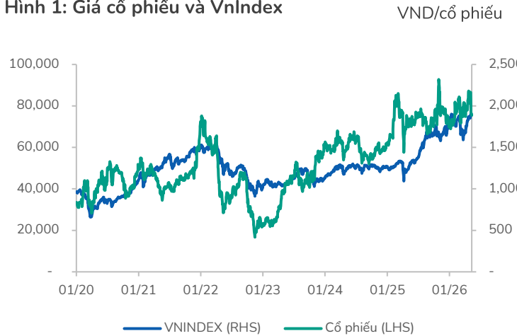
Hình 1: Giá cổ phiếu và VnIndex

BSC tiếp tục duy trì khuyến nghị MUA đối với cổ phiếu CTD với giá mục tiêu cuối năm 2026 (Tương đương Quý 2 NĐTC 2027) là 96,500 VND/CP (Upside +30% so với giá đóng cửa phiên sáng ngày 25/05/2026) với P/B mục tiêu = 1.0x. BSC vẫn duy trì các Quan điểm đầu tư như cũ: Ngành xây dựng đang phục hồi, và CTD là chủ đầu tư niêm yết trên sàn lớn nhất, sẽ hưởng lợi từ xu hướng ngành phục hồi này. So với Báo cáo trước đó, BSC gần như giữ nguyên giá mục tiêu. Mức Upside 28% phản ánh việc cổ phiếu CTD bị chiết khấu mạnh bởi các thông tin tiêu cực trong thời gian qua. BSC lưu ý rủi ro nợ xấu khi ngành xây dựng đi xuống.