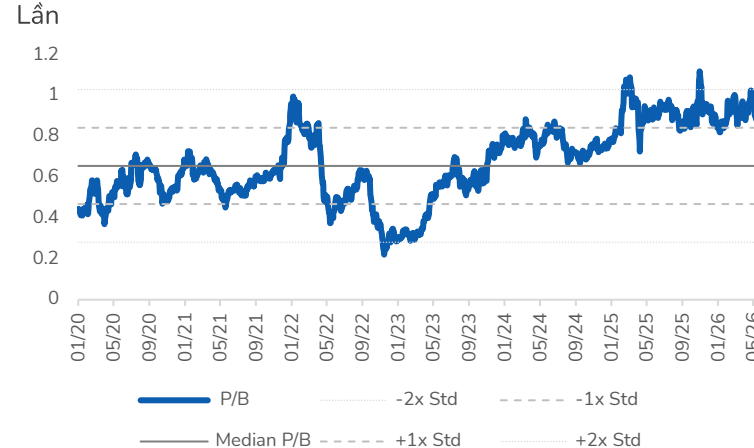
Hình 2: Định giá P/B